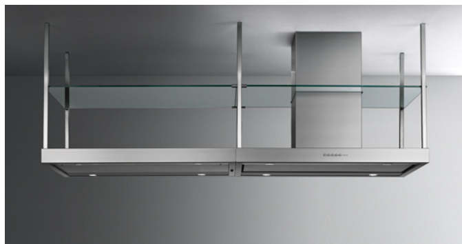
Poglądowe zdjęcie produktu

Zdjęcie może dokładnie nie odpowiadać wybranej wersji